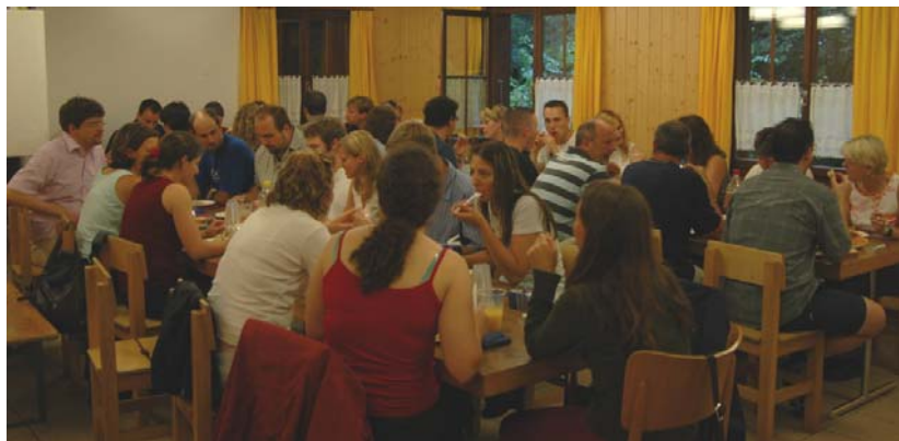
Pfadi-Hütte statt Ruine Dorneck: doch von einem Gewitterregen lassen sich die FT Alumni weder den Spass noch den Apetit verderben.