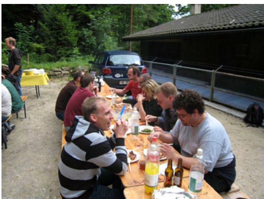
Beim Grillplausch dreht sich alles um den geselligen Austausch

war dank der hervorragenden Organisation und den Gaumenfreuden vom Grill und aus den Küchen der Teilnehmer grossartig!